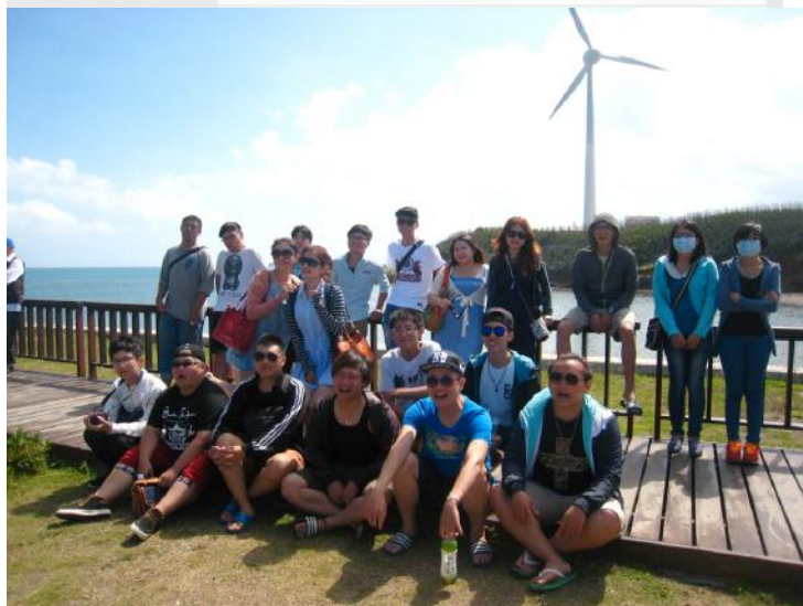
帶隊澎湖畢業旅行