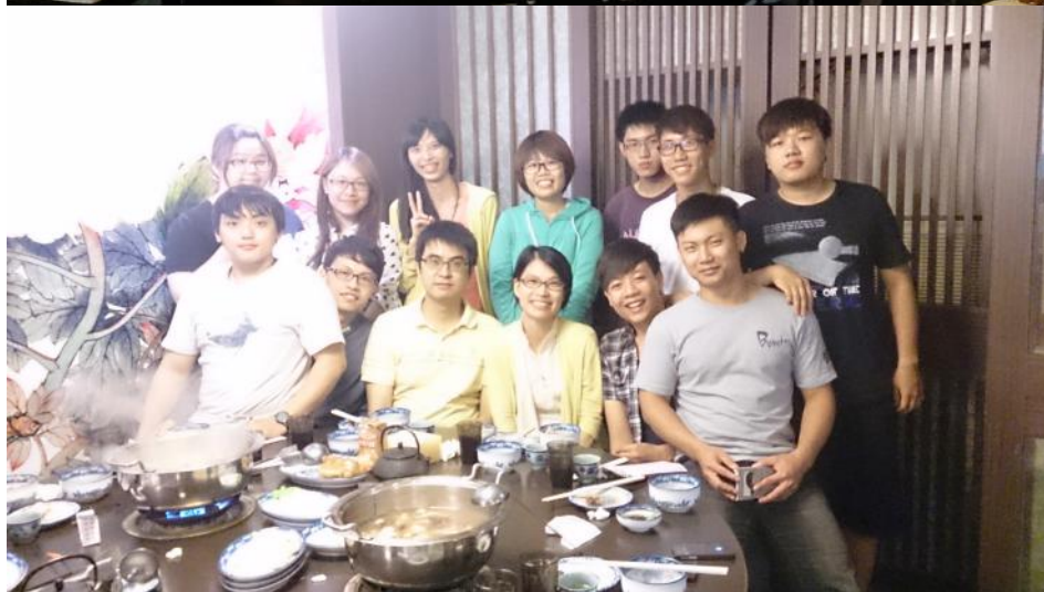
班級小組期末聚餐