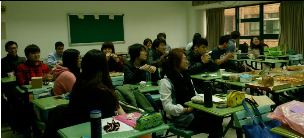
舉辦班級聖誕節交換禮物活動