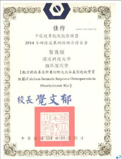
指導學生參加校外專題競賽獲獎