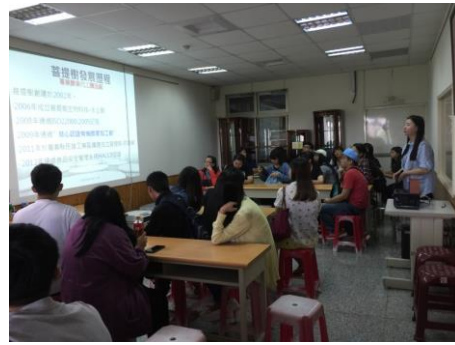
校外教學參訪，讓學生及早職場體驗