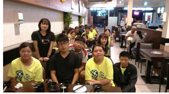
畢業典禮這天協助擔任交通指揮的志工