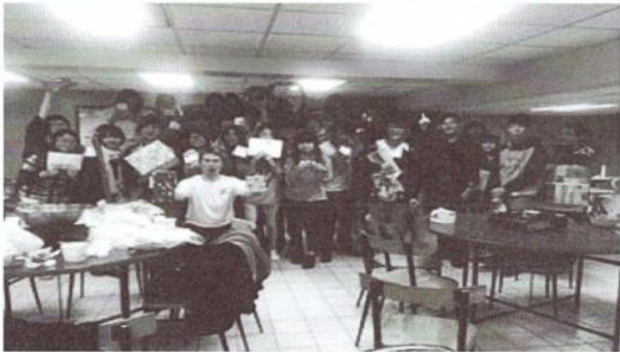
名稱:聖誕節活動 103.12.25 宿舍餐廳