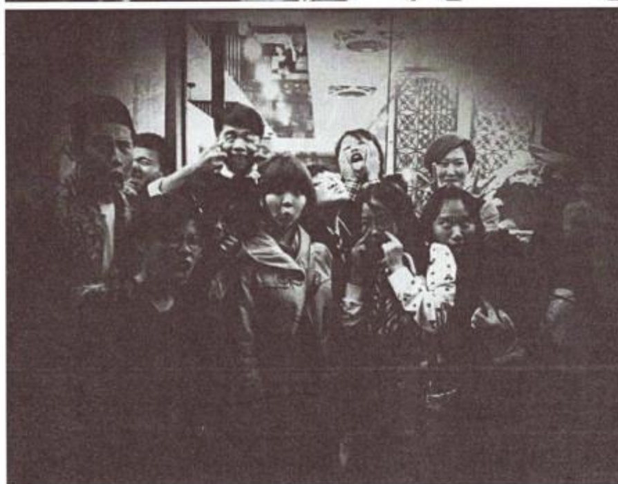
名稱:班級聚餐 103.12.04 旭火鍋