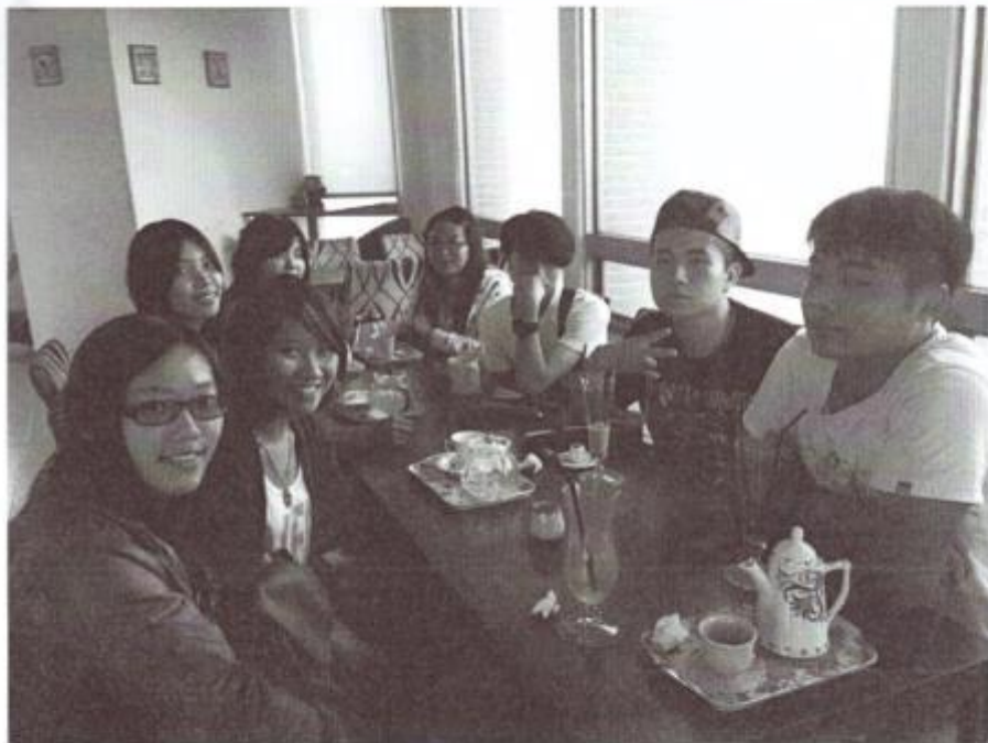
名稱:幹部會議 103.10.29 愛月樓咖啡