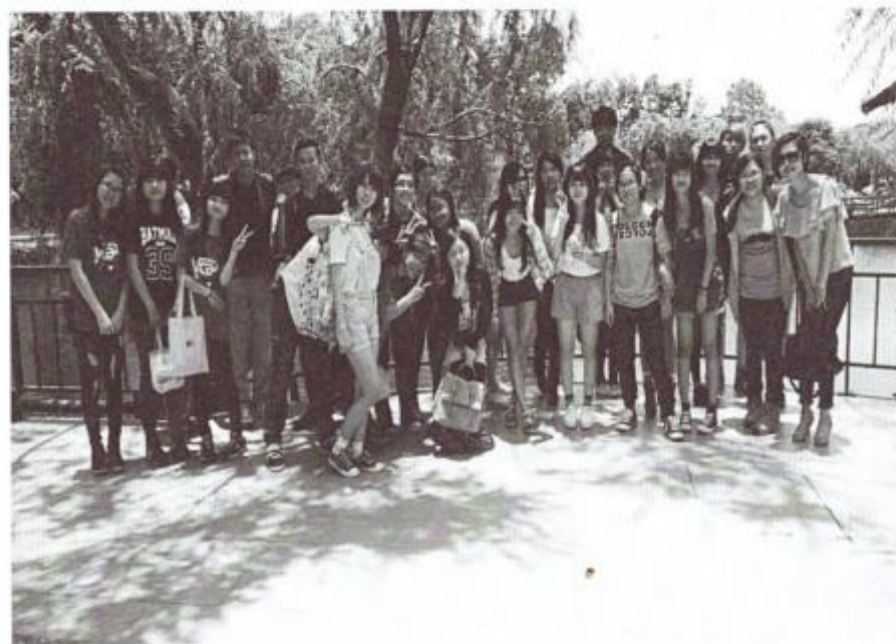
名稱:班級聚餐 104.06.10 湖畔餐廳