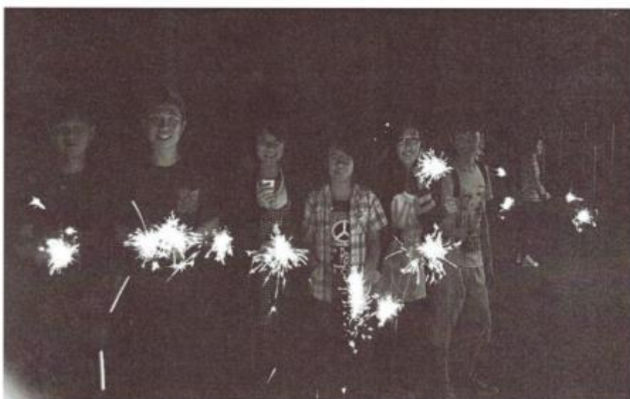
名稱:迎新活動 103.10.15 宿舍餐廳前