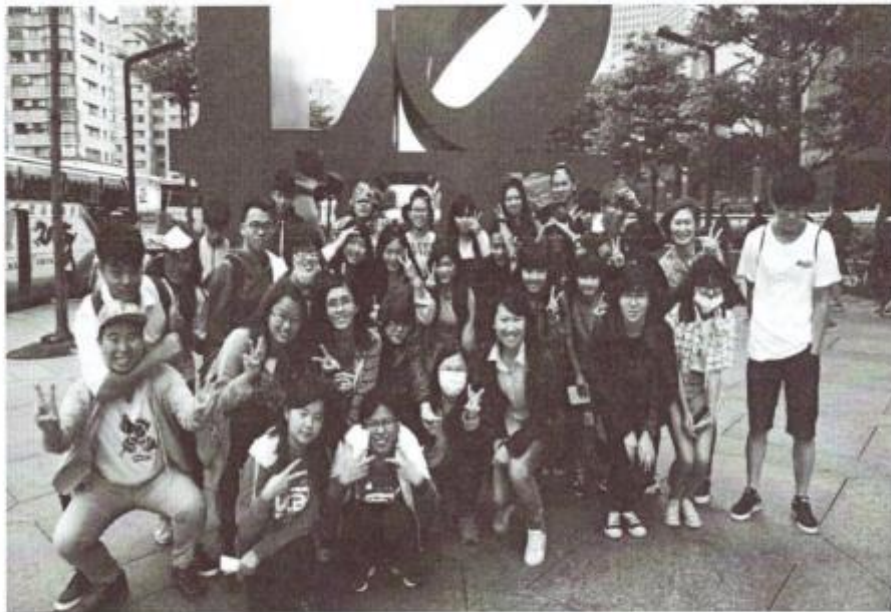
名稱:新一代設計展 104.05.04 台北市世貿展覽館