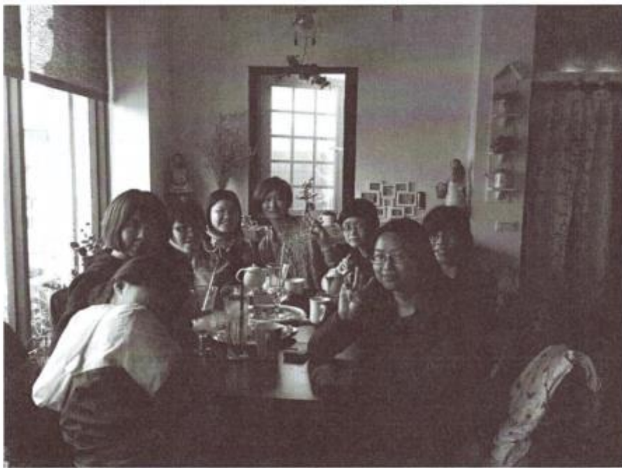
名稱:分組座談 104.03.25 真咖啡