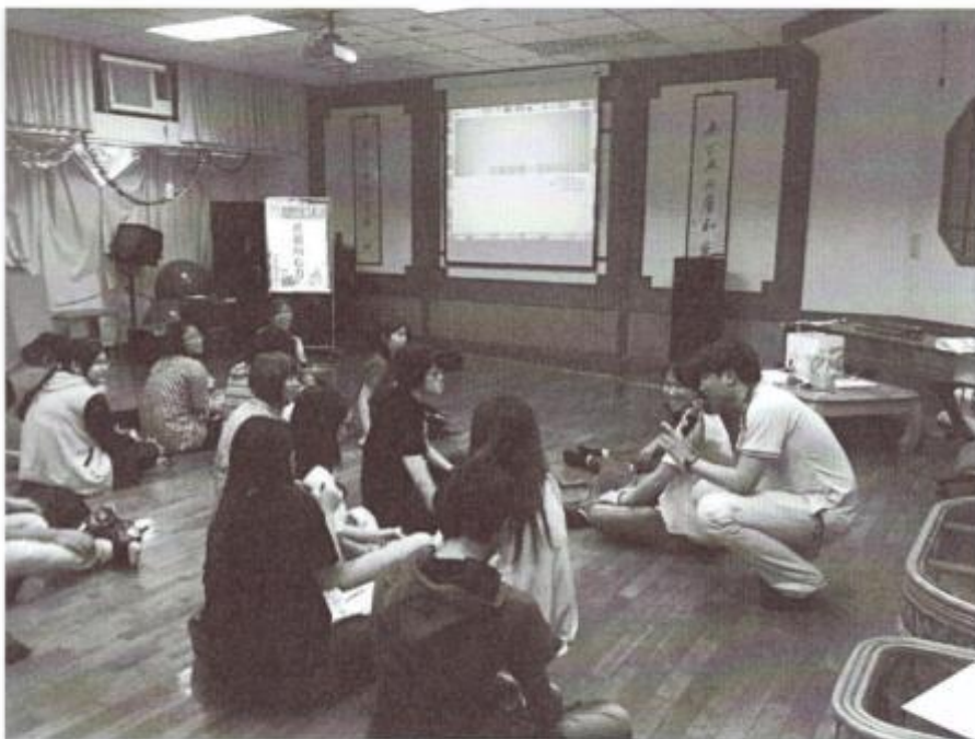
名稱:班級講座 104.05.14 諮商中心團體室