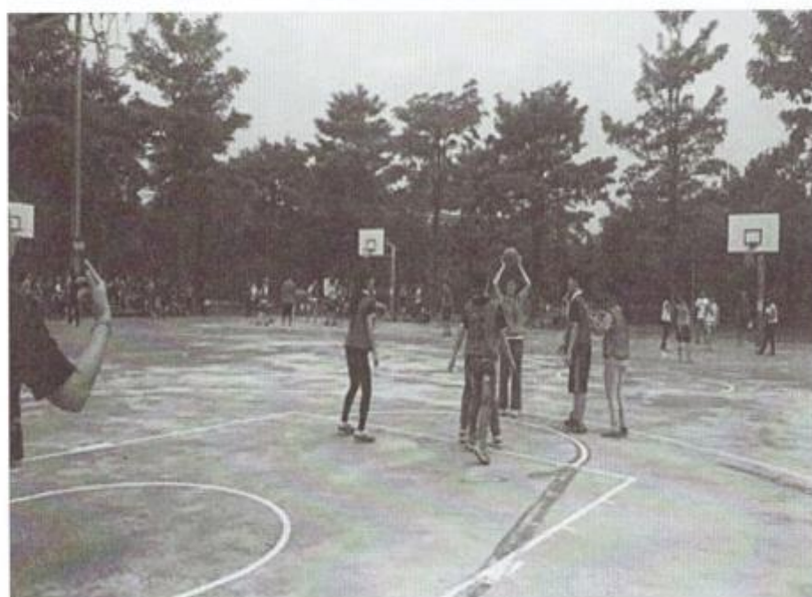
名稱:新生盃籃球比賽 103.11.13 籃球場