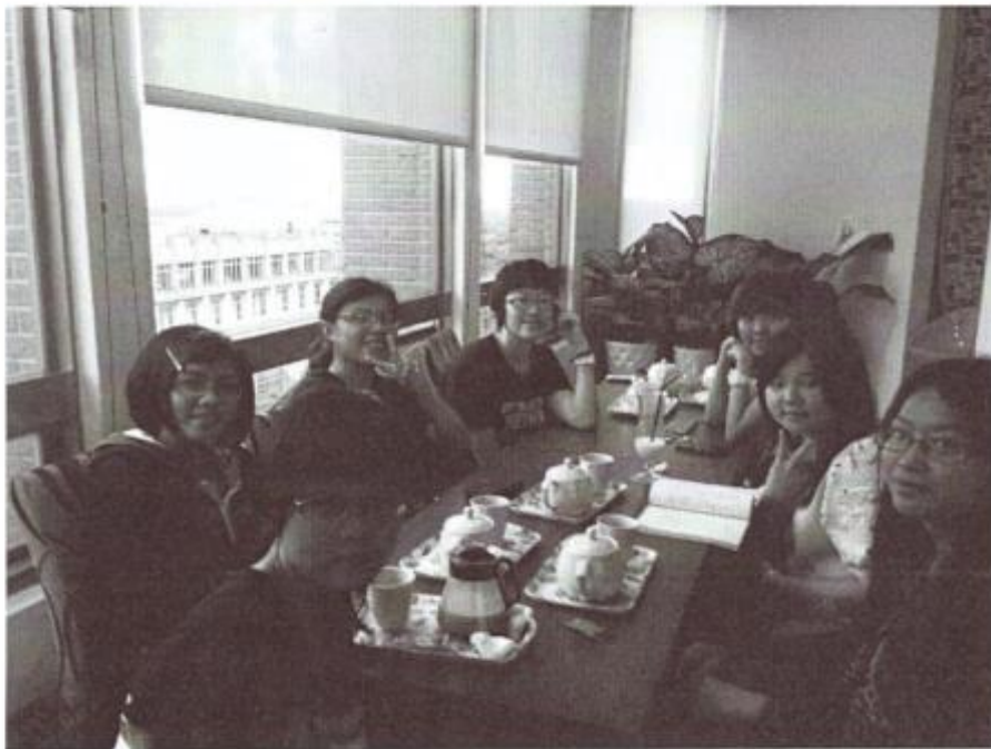
名稱:分組座談 103.10.01 愛月樓咖啡