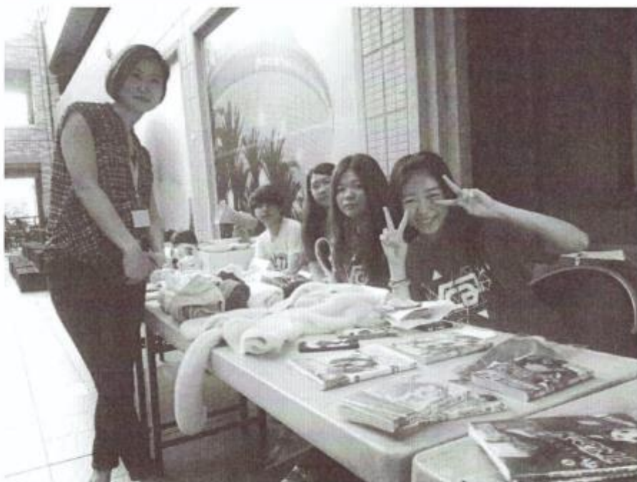
名稱:二手義賣活動 104.05.19-05.21 創意樓中庭