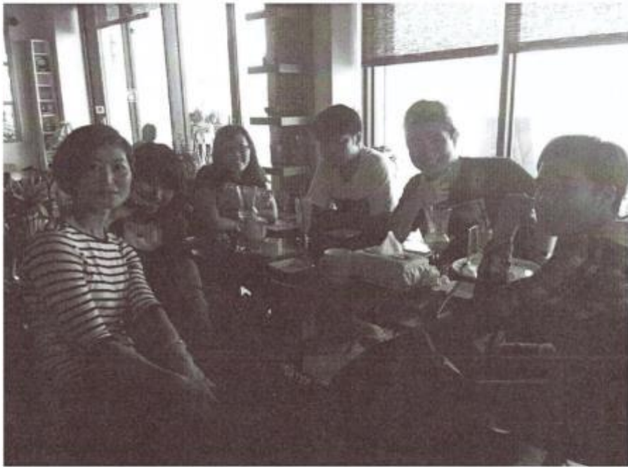
名稱:分組座談 104.03.18 真咖啡