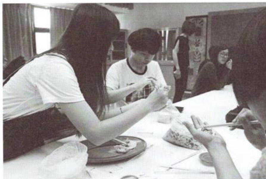
名稱:包水餃活動 104.06.24 創意樓 DC402 教室