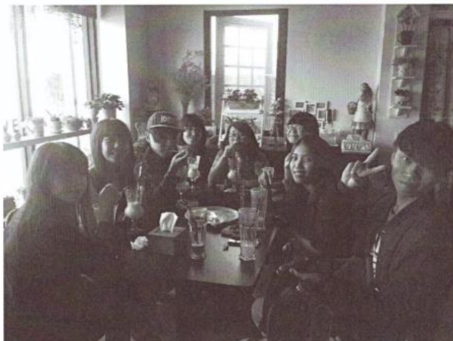
名稱:分組座談 104.04.15 真咖啡