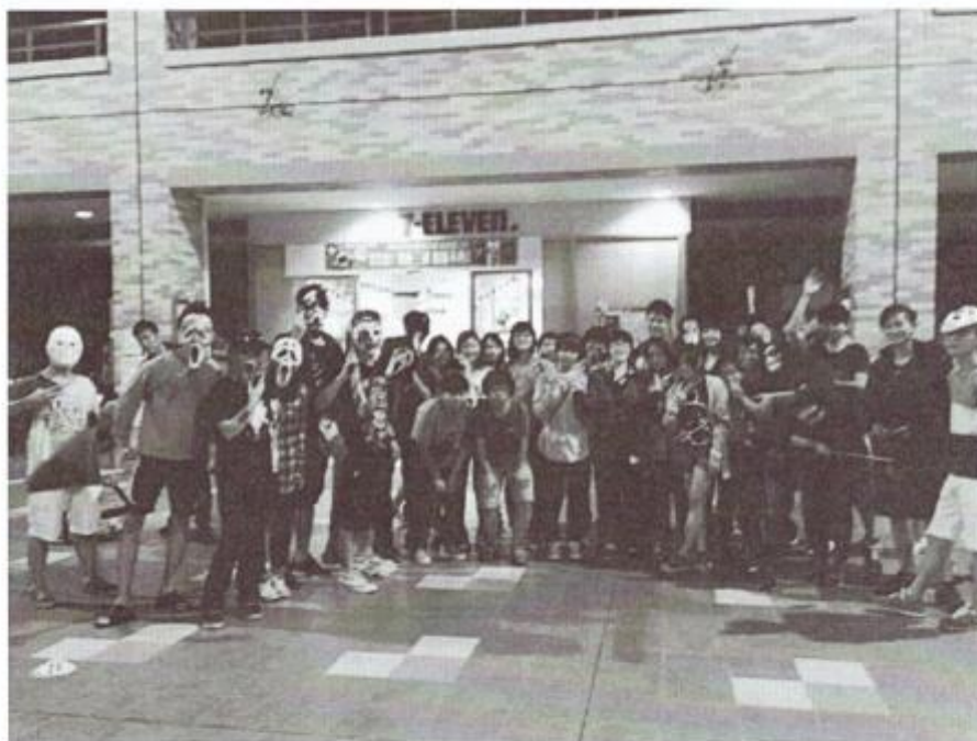
名稱:萬聖節活動 103.10.31 創意樓中庭 校園