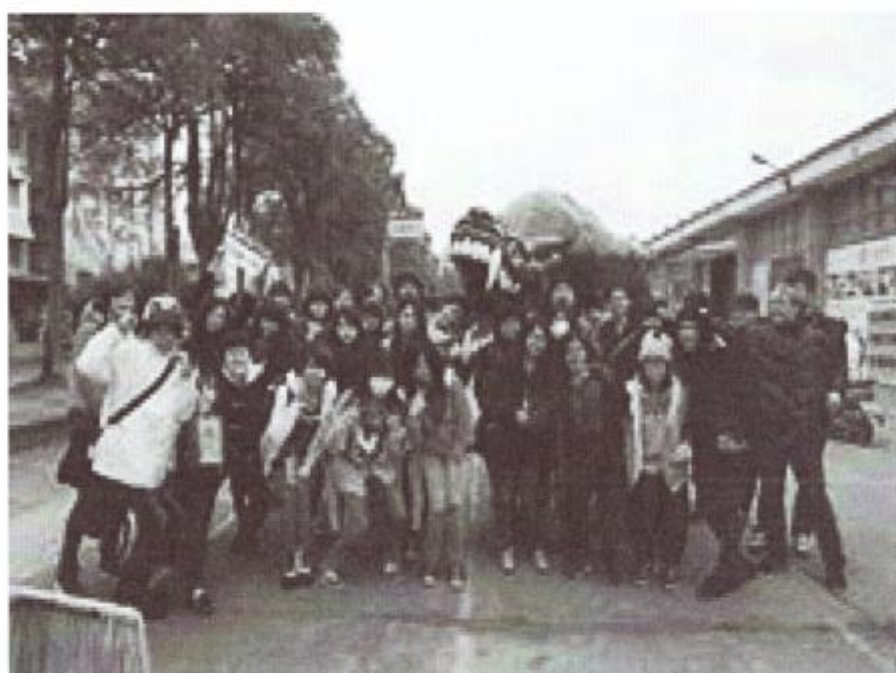
名稱:駁二特區參訪 103.12.19 高雄市