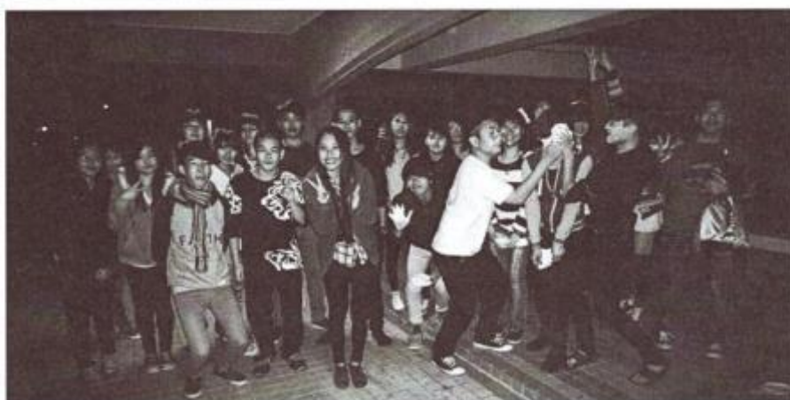
名稱:烤肉活動 104.01.22 宿舍餐廳前