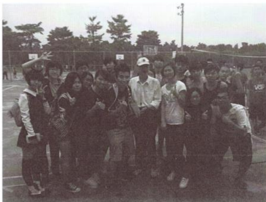
名稱:視傳系躲避球比賽 103.11.12 排球場