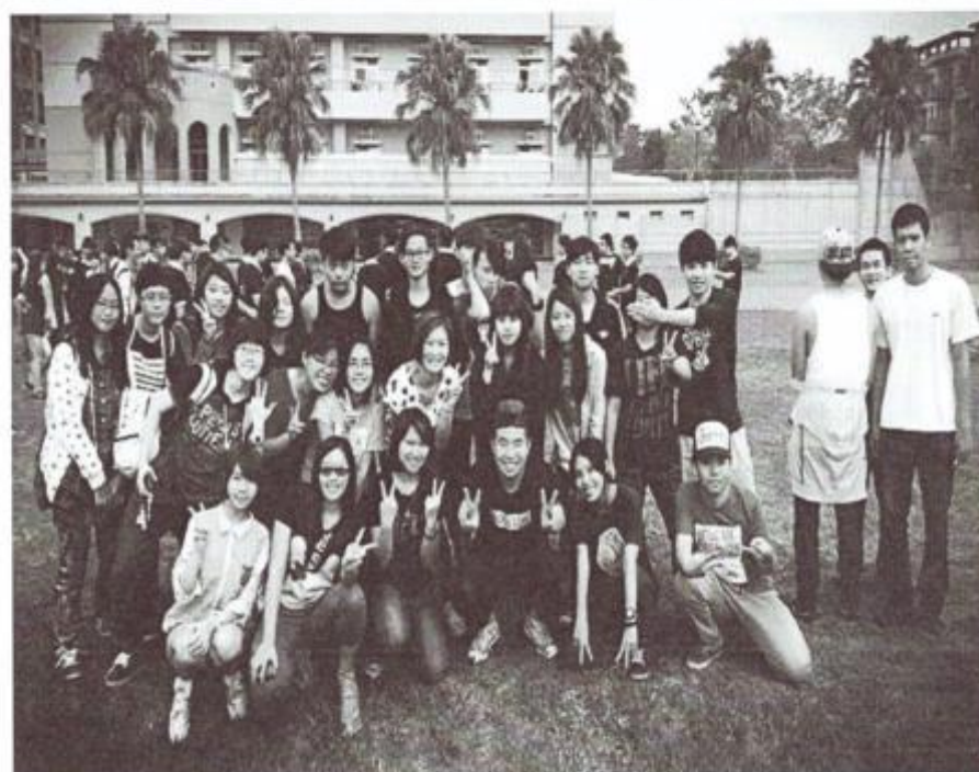
名稱:新生盃拔河比賽 103.11.05 運動場