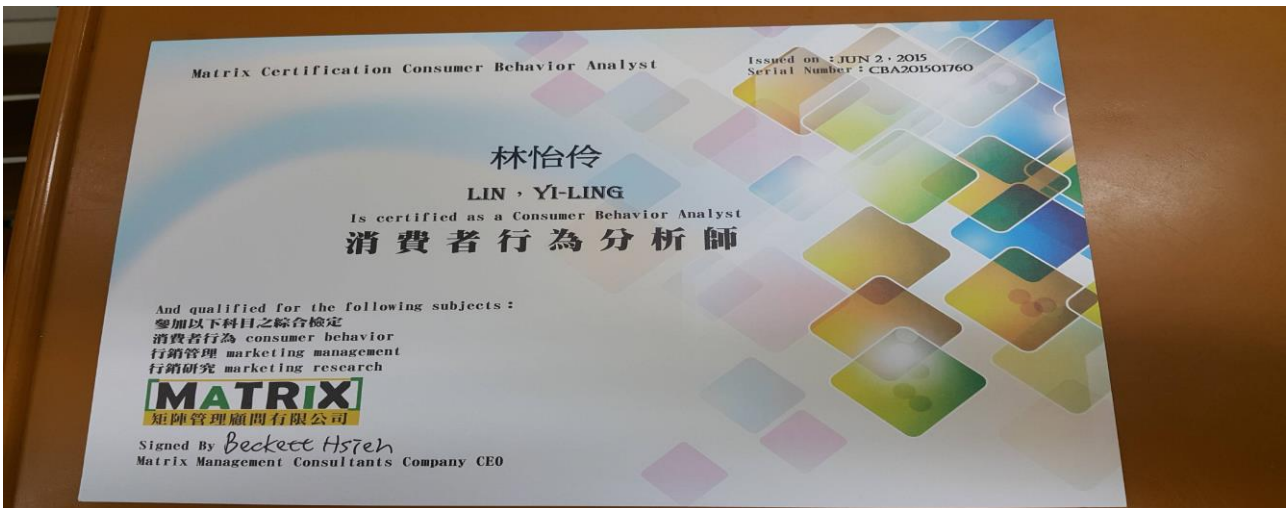
鼓勵學生考取證照一例