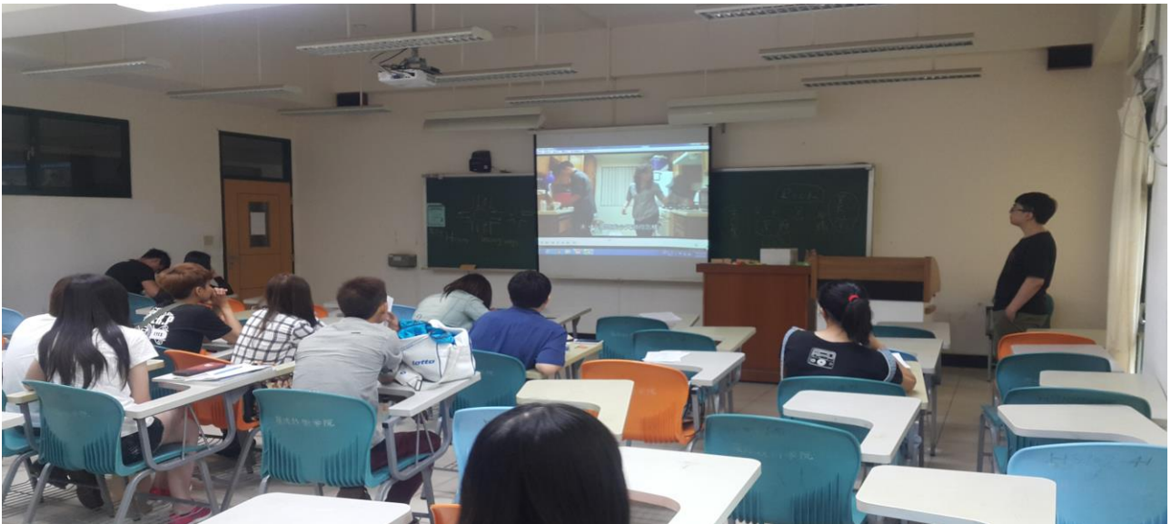
利用班會時間，安排諮商輔導中心課程