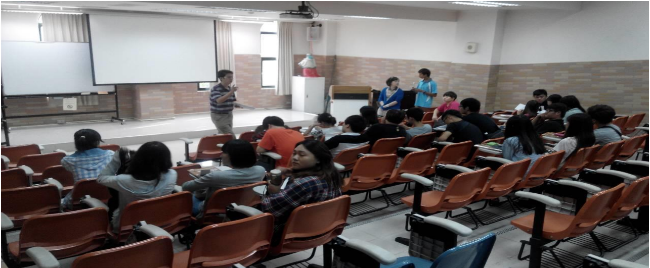
利用班會時間，邀請課務組長說明課程選修