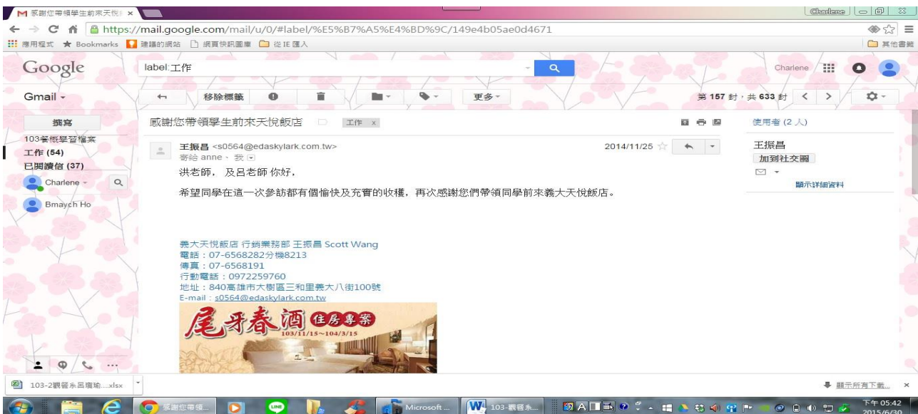
帶領學生進行校外參訪活動