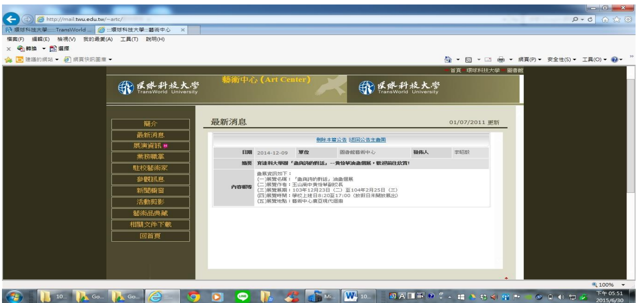
帶領全班參與藝文活動一例