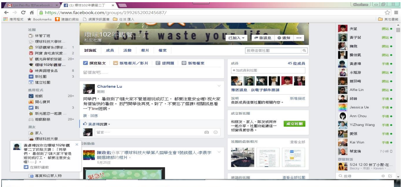
利用 FB 班網，與學生互動