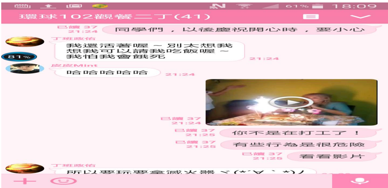
利用 line 班網，與學生互動