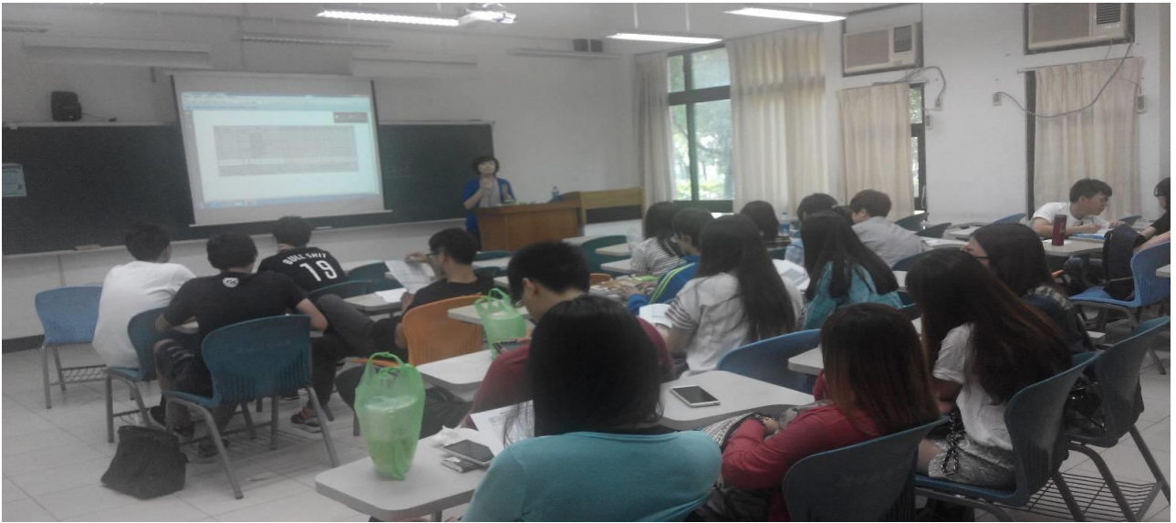
定期召開班會，溝通與傳達相關事項