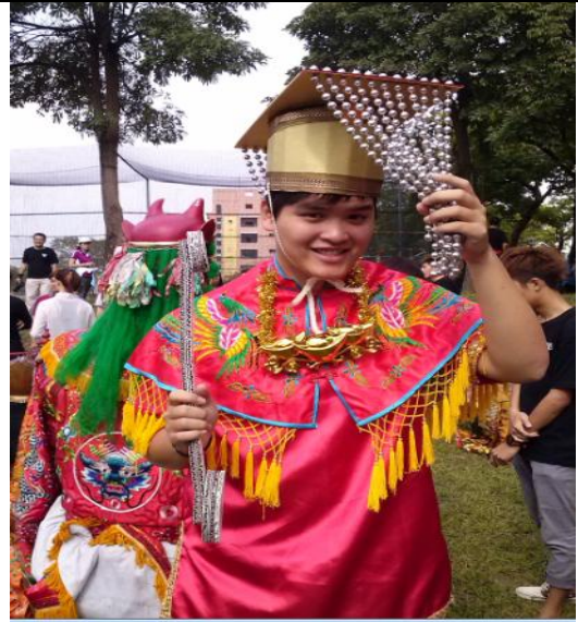
運動會創意變裝-今日我最紅