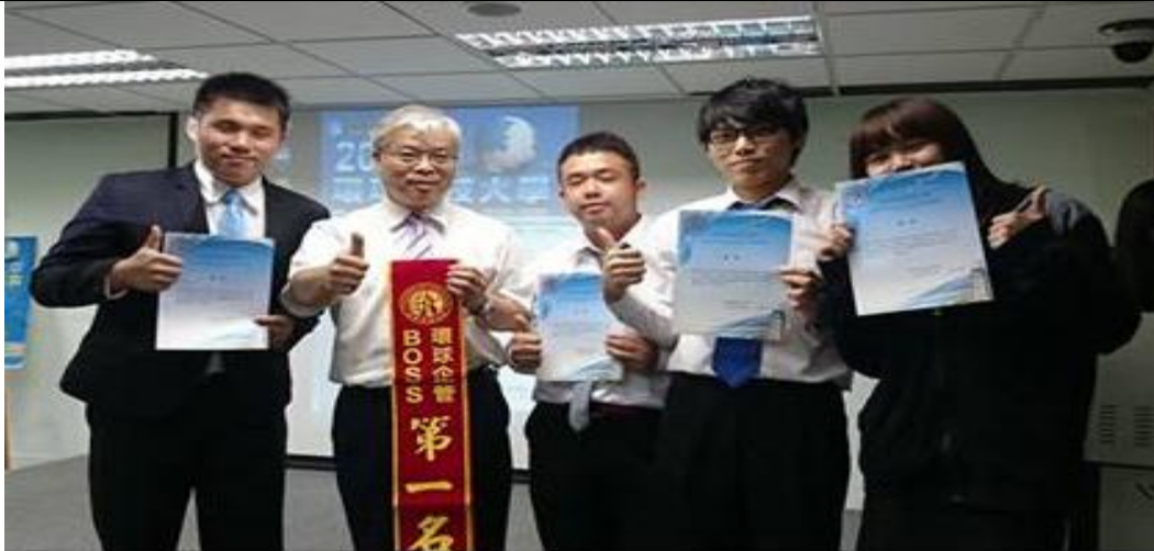
2014 全國大專 BOSS 競賽勇奪第一名，與企管系主任合影