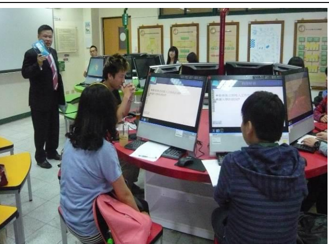
邀請業師分享創業成功心得