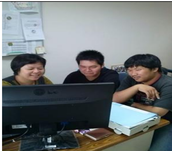
課後到教師研究室進行補救教學