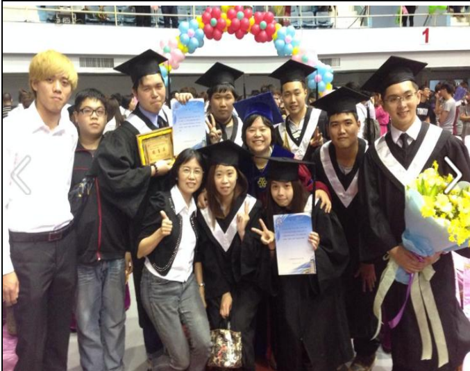
畢業典禮與導師和秘書合照