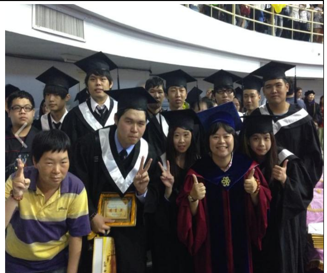
班代的家長與導師、同學一起畢業大合照