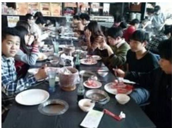
102-1 期末千葉火鍋聚餐