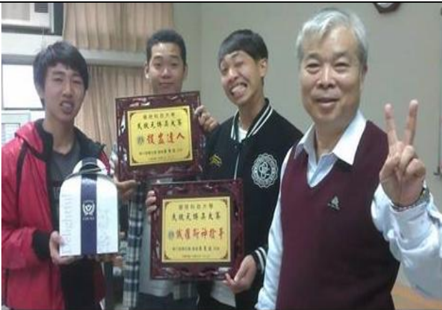
環科大武狀元博奕大賽在企管系，與主任合影