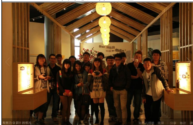
全班到品皇咖啡參訪