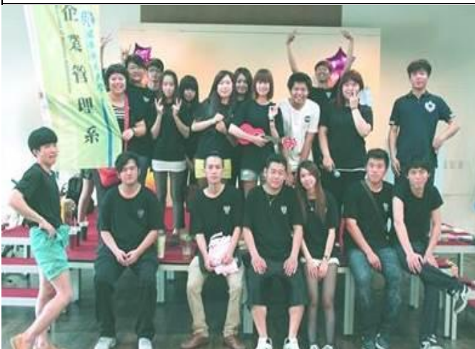
辦理企管系期末系員大會後大合照