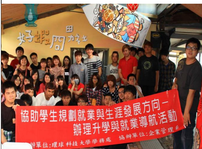
參訪好蝦問男社分享青年創業成功經驗