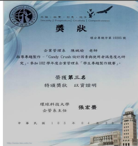
企管系畢業專題第三名