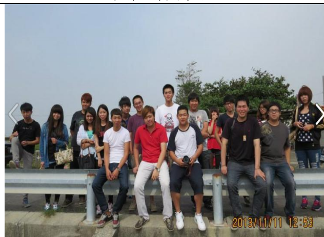
金湖休閒園區合影