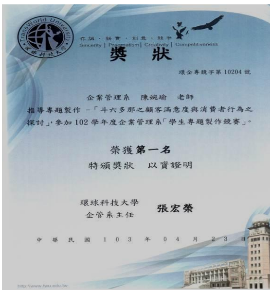
企管系畢業專題第一名