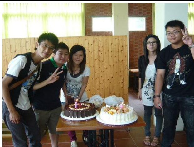
不定期舉辦慶生會