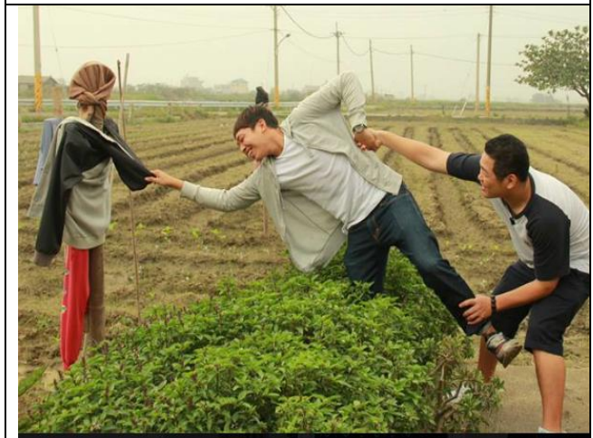
三位稻草人~猜猜誰是假?