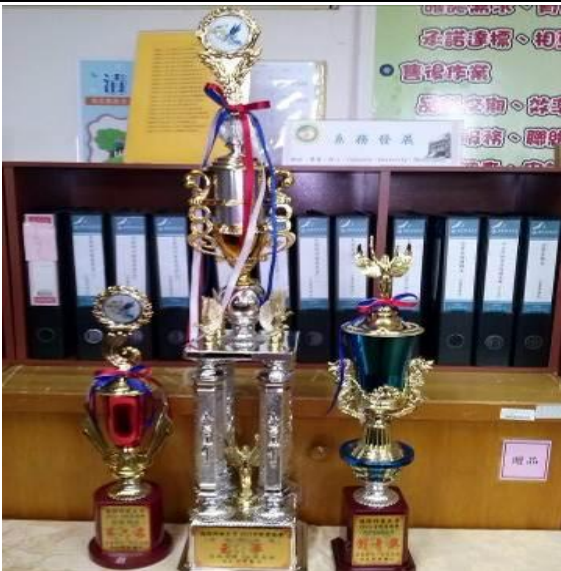
運動會榮獲創意秀和班級總錦標