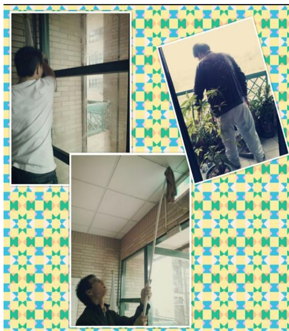
年底全班動起來為系上大掃除