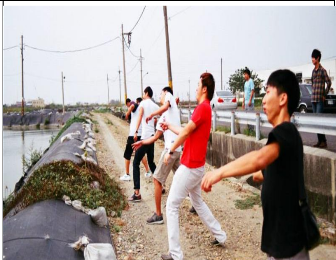
比賽打水飄看誰比較厲害