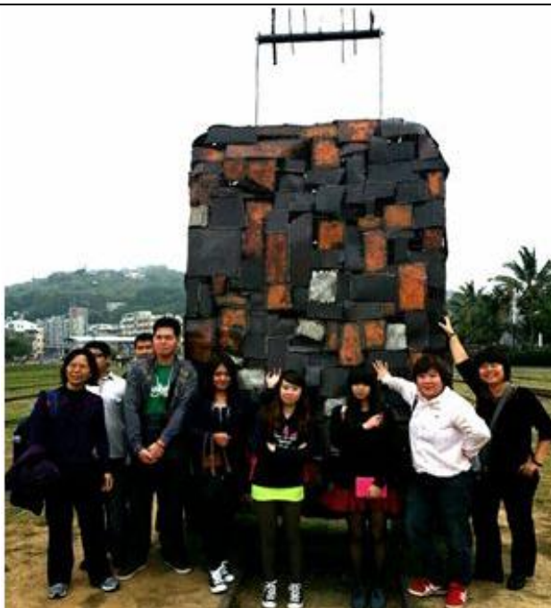
高雄駁二特區班遊