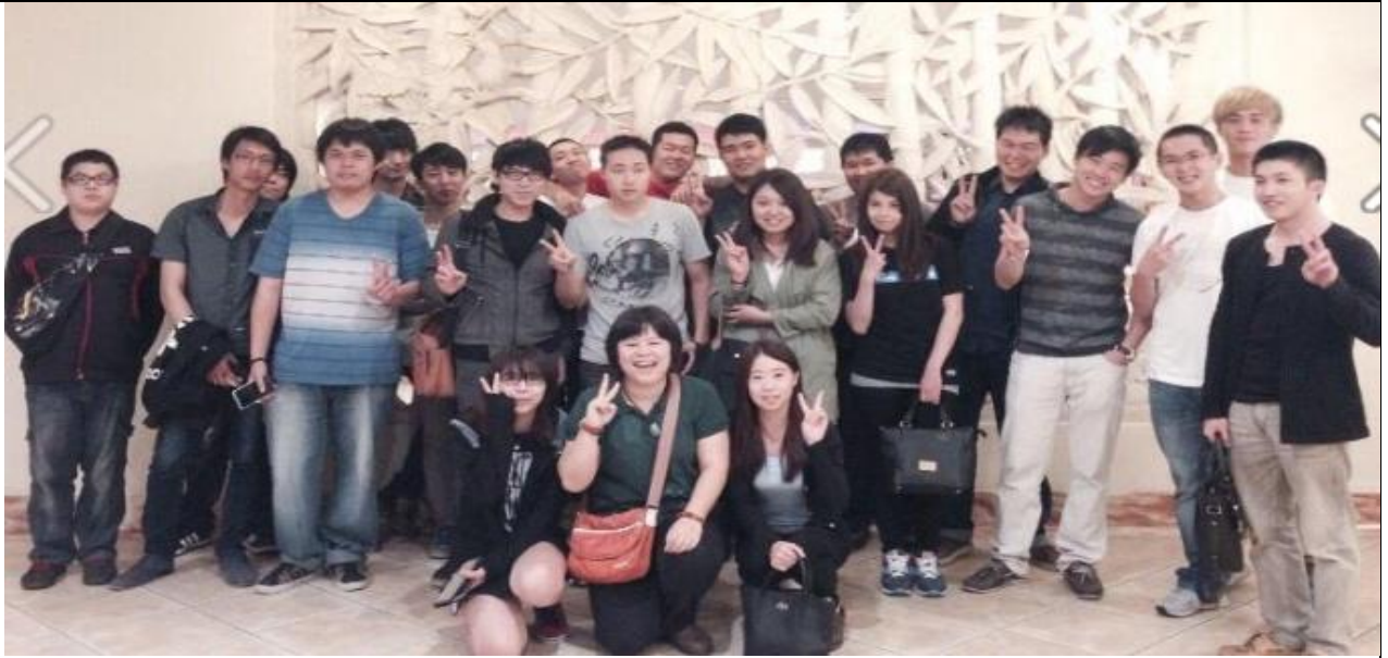
畢業謝師宴~劍湖山王子大飯店