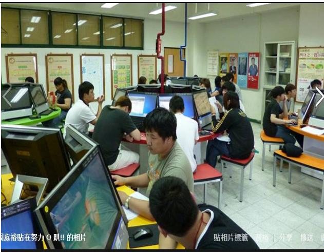
課後輔導同學進行證照考試