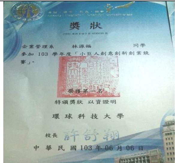
創意創新創業競賽第一名