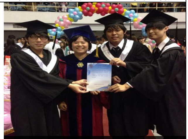
頒發畢業專題競賽得獎者獎狀