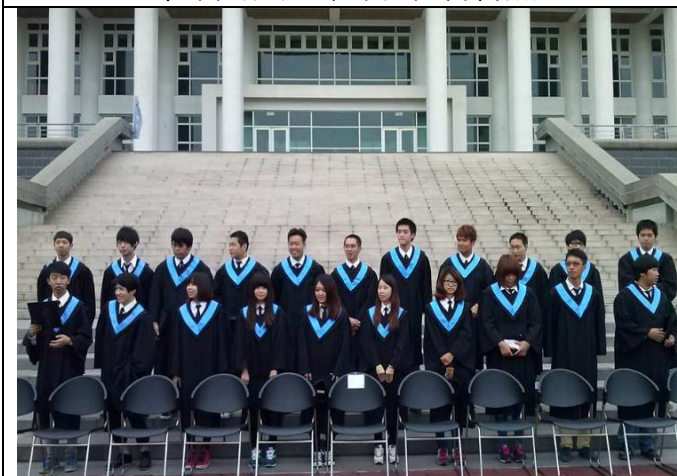
一二三~笑嘻嘻(畢業團拍)