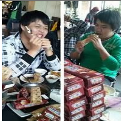
吃冰大賽~冠亞軍出爐