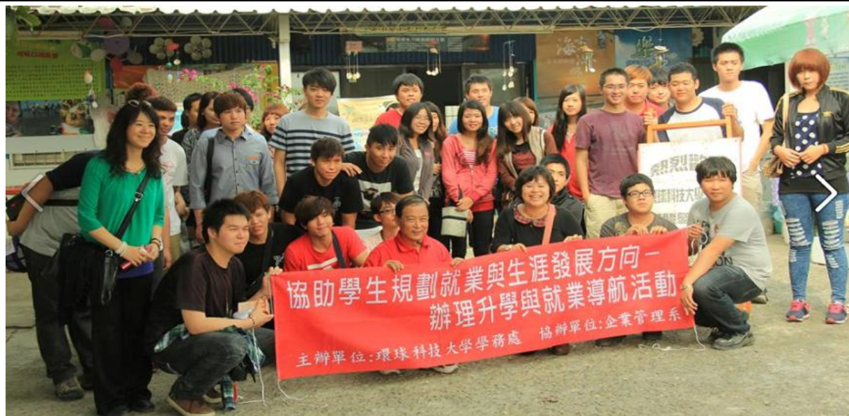
102 學年度學輔活動~(口湖鄉金湖休閒農業發展協會)