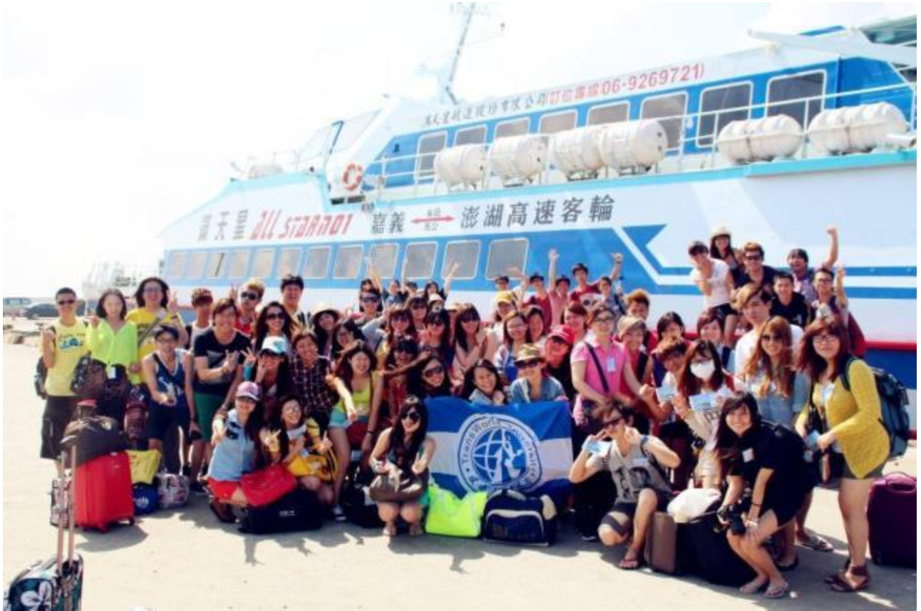
圖八 馬專班澎湖旅遊(二)