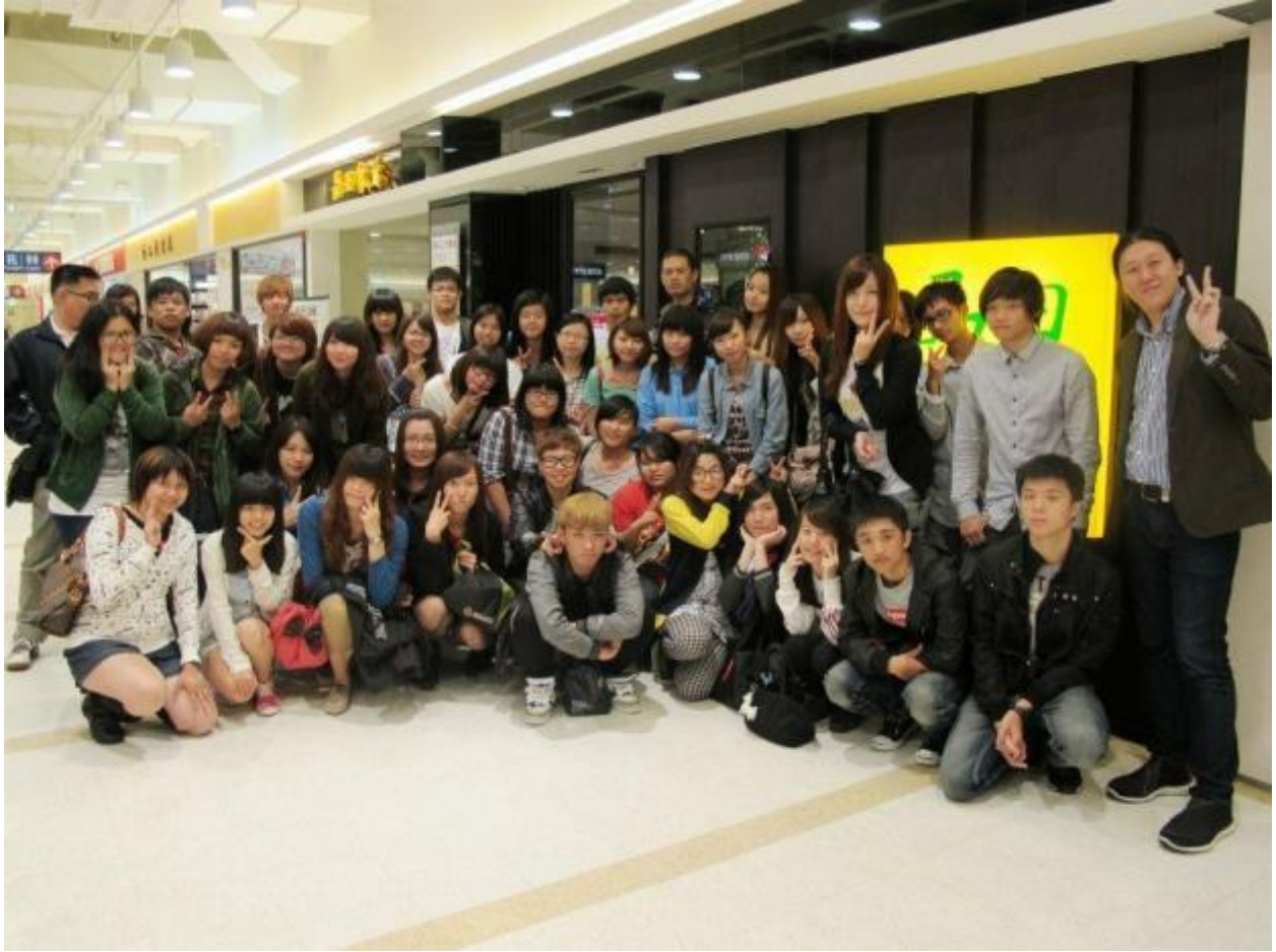
圖四 四視二乙期末聚餐(二)