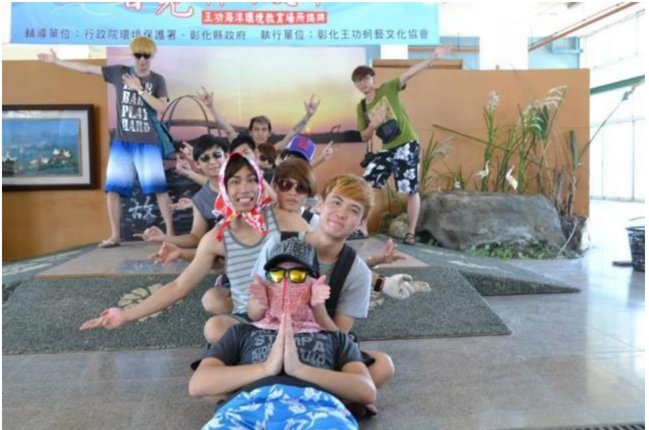
圖十二 海青班一甲與四視二乙同學國際學伴聯誼會