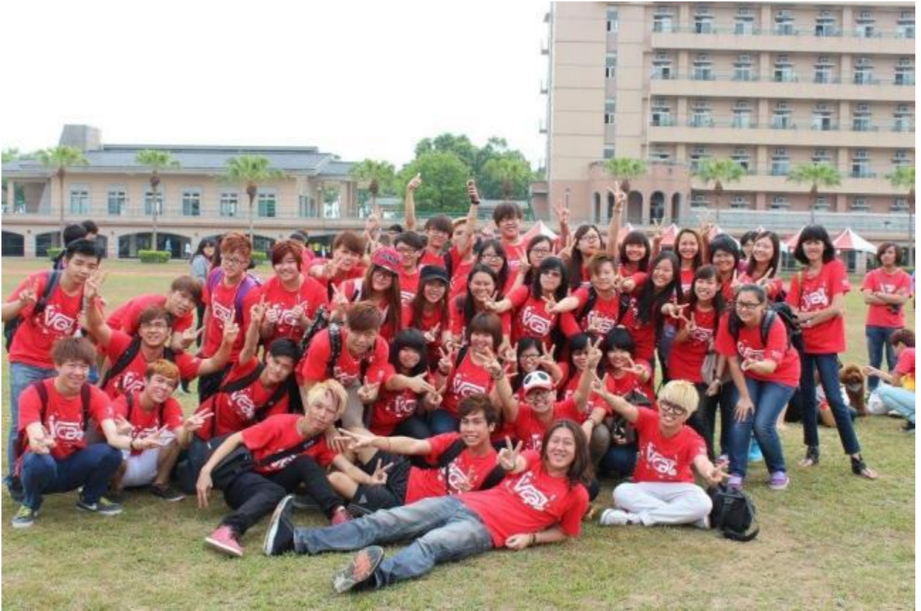
圖十 海青班一甲台北新一代設計展參訪