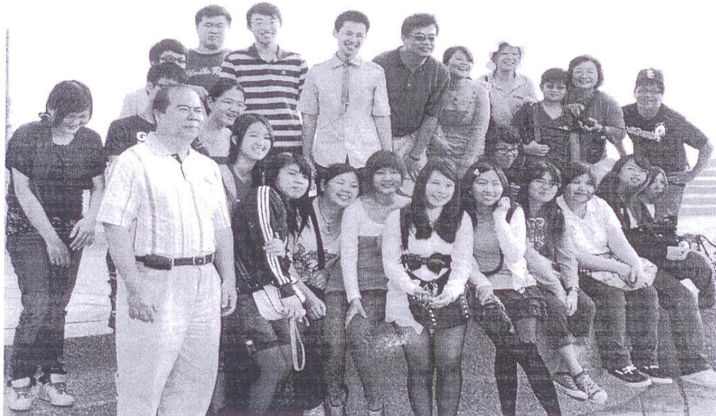
高雄義大戶外教學