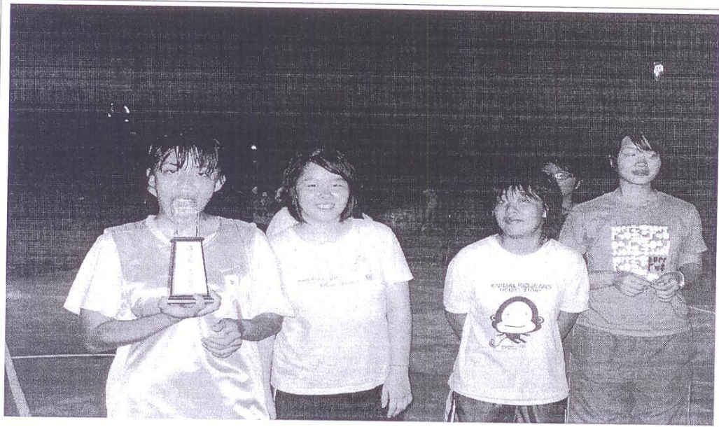
籃球賽 為同學加油