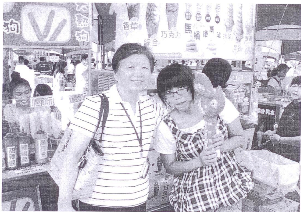
園遊會擺攤賣熱狗 冰淇淋